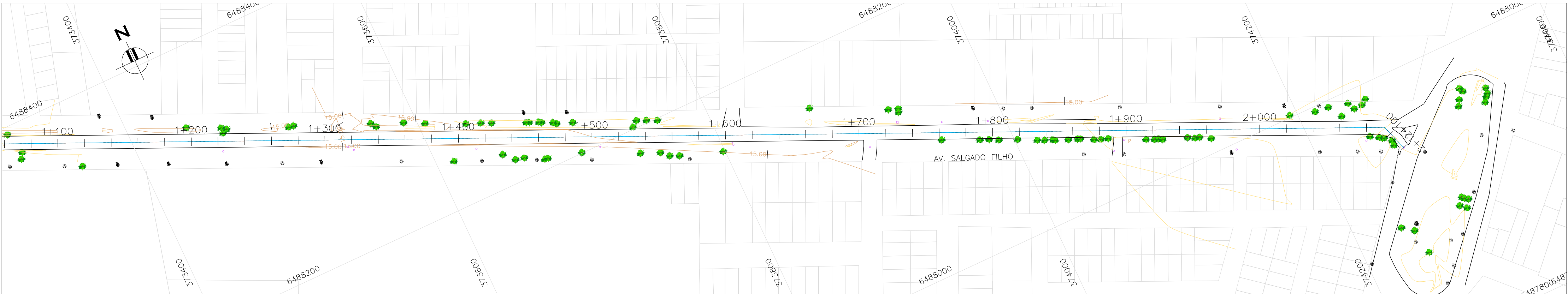
PLANTA BAIXA 2/2 ESCALA: 1:2000 (A1) 1:4000 (A3)